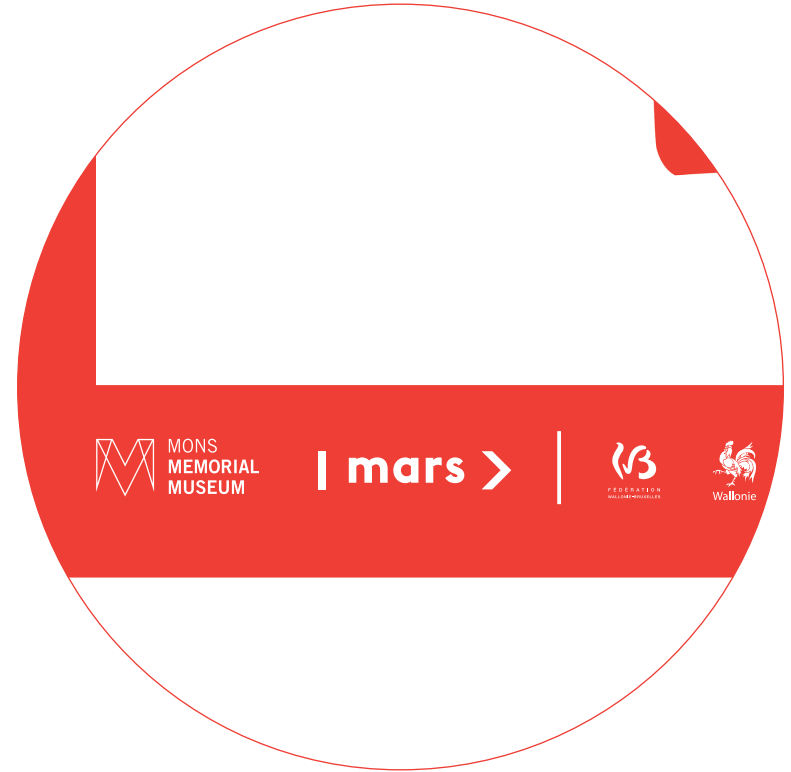
Illustration: Gabriel Fataou - 2017